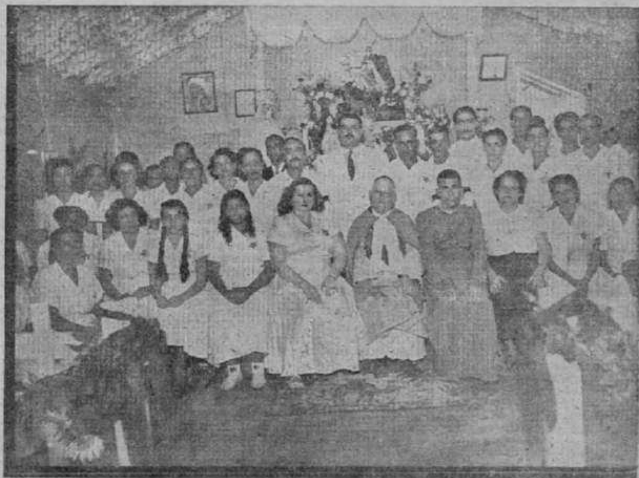
S. Ex. Revma. o Sr. Dom Carlos Duarte Costa, Bispo do Rio de Janeiro, celebrando missa no "Centro Espírita Jorge das Sete Cachoeiras", em Vicente de Carvalho

1) A Nação está exigindo, das duas casas do Congresso, uma lei que ponha termo à imoralidade da multiplicidade de desquitados; 2) Essa exigência é feita pelo eleitorado brasileiro, que derrotou a LEC, nas eleições de 3 de outubro de 1950; 3) A redação do art. 163 da nossa Carta Magna, declarando que a família é constituída pelo casamento de "vínculo indissolúvel", é a capitulação do Estado a uma potência estrangeira: "O Vaticano"; 4) O matrimônio não é sacramento. É contrato, previsto pelo Vaticano e, maldosamente, não pre-