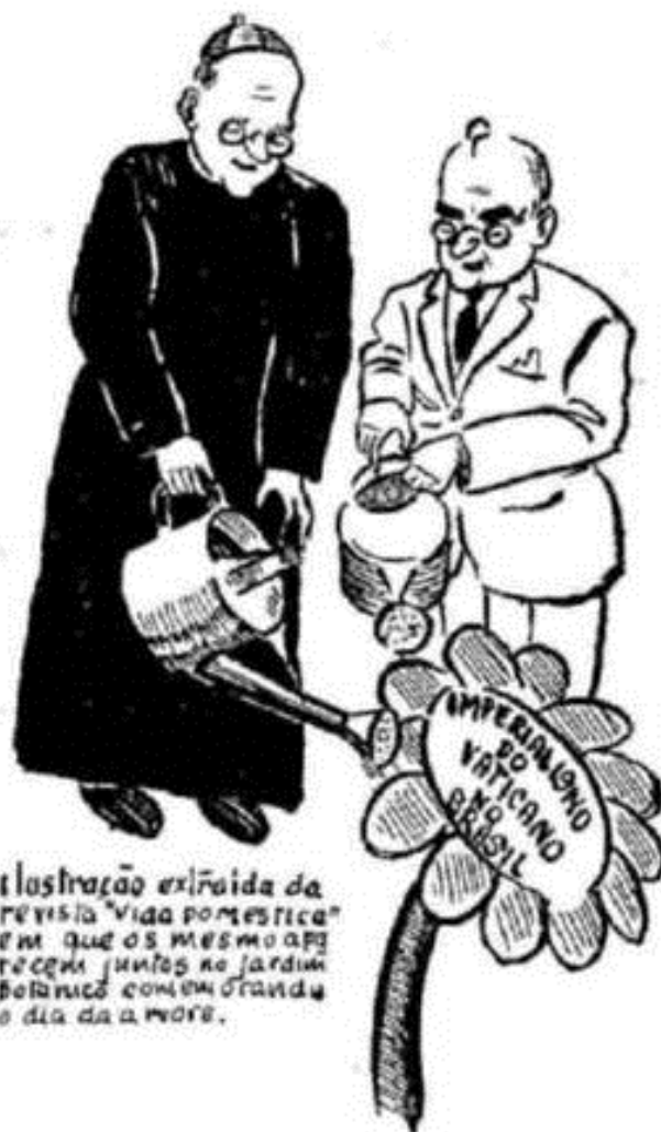
Ilustração extraída da revista "Vida Doméstica" em que os mesmos aqui retratados, juntos no jardim botânico comemoravam o dia da a morte.

A escravização material é estúpida; a escravização do espírito, essa sim é profícua. Reduz o