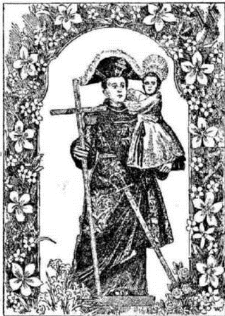
Santo Antonio de Lisboa com as crianças órfãs

Lendo "O GRANDE (e misterioso) SUBTERRANEO", reportagem de Rubens Vidal e fotografias de Antônio Ronck, revista do "GLOBO", n.º 539 de 27-7-51, de Porto Alegre, alimentei a curiosidade