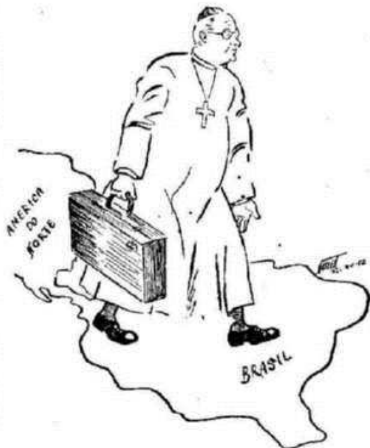
O Cardinal Spelman carregando os minérios do Brasil. Esse o fito da sua viagem. O Brasil é o "quintal" do Vaticano e dos Americanos!...

Em consequência disso, requereu a Autora mandado de Segurança contra o ato do Sr. Presidente da República da época, que acolheu dita representação e, com isso, violou as franquias constitucionais da liberdade de culto que mili-