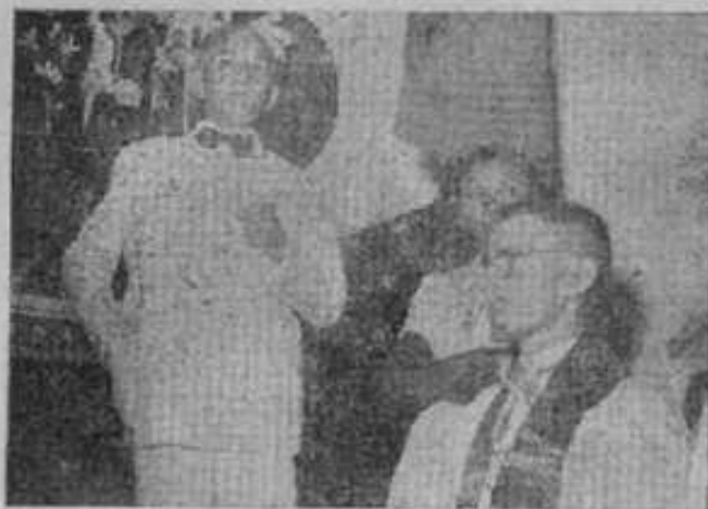
E no meio da indignação popular, pela proibição da saída da procissão, a PÁTRIA é engrandecida...