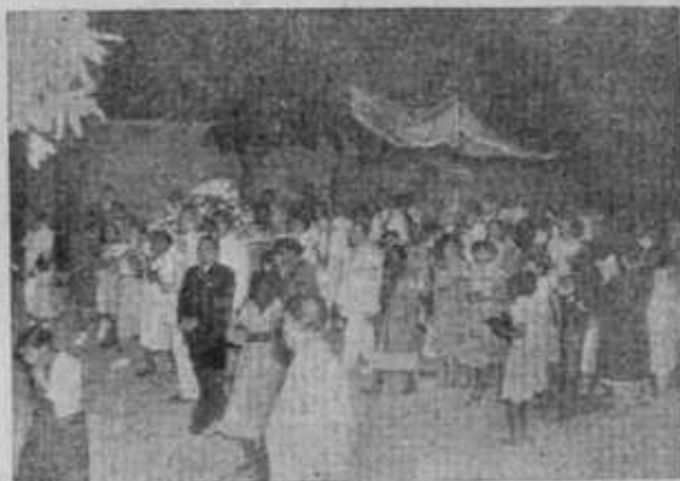
Entrada da procissão de N. S. Menina, no dia 10 de setembro de 1951.

visto pela nossa Constituição, devido ao seu inspirador, padre Leonel Franca, da Companhia de Jesus; 5) A indissolubilidade do matrimônio cai, diante da lei natural, que é eterna; 6) Os constituintes de 1946 esqueceram-se que estavam legislando para uma nação e não, simplesmente, para brasileiros, que colocam a autoridade do seu chefe espiritual, estrangeiro, acima da autoridade do Estado; 7) O Vaticano admite a ruptura do "vínculo" matrimonial, em casamentos consumados, entre os não batizados, por motivo de fé. É o chamado privilégio paulino. (Can. 1.120 do Código de Direito Canônico); 8) O Vaticano quebra o "vínculo" matrimonial, entre batizados ou uma parte batizada e a outra não, podendo ser dissolvido pelo direito, pela profissão religiosa ou por motivos a critério do Papa. (Can. 1.119 do Código de Direito Canônico); 9) Moisés, São Matheus e São Paulo admitem o divórcio; 10) A Igreja Oriental é favorável ao divórcio, por adultério. As duas casas do Congresso não devem levar em consideração esses telegramas, passados por crianças ou por cérebros narcotizados pelo fanatismo jesuítico.