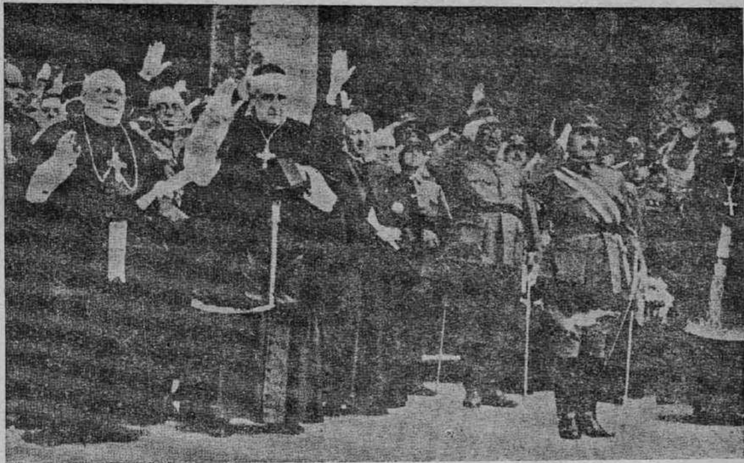
A Hierarquia Católica Espanhola fazendo a saudação fascista, em S. Tiago de Compostela, em 1937; da esquerda para a direita: O Bispo de Lugo, e o Arcebispo de S. Thiago, o General Dávila e o Bispo de Madrid.

cias e orações. Sua Eminência concede aos RR. Sacerdotes as necessárias faculdades para rezarem, na feste de São Miguel Arcanjo, desde às primeiras vésperas o "Exorcismus in satanam et angelos apostaticos" jussu Leonis XIII P.M. editus (Rituale Romanum — Benedictiones novissimae).