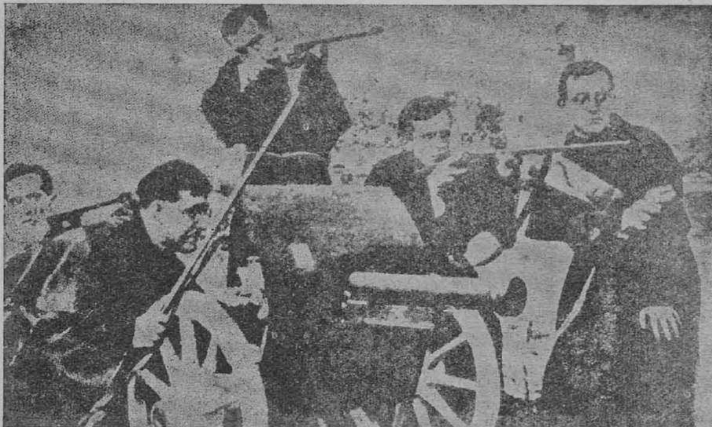
Sacerdotes da Igreja Romana, manejam fuzis e metralhadoras, na revolução que levou ao poder o General Franco. Esta foto foi encontrada no Palácio do Conde Vilellano e publicada no Livro "Por traz dos Ditadores", está o Poder Político do Vaticano. E', isto o que está fazendo, no Brasil, o Vaticano, pelos seus funcionários: O Núncio, os Cardiais, o Episcopado, a Ação Católica, a Lec e etc.