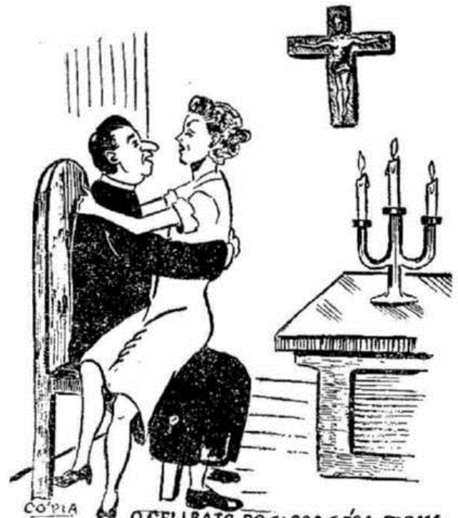
CÓPIA O CELIBATO DO CLERO GÉRA, FORMA, CRIA ESSE AMBIENTE.

Jesus Cristo, quando distribuiu a primeira vez a Eucaristia, não exigiu que alguém se confessasse. Da mesma forma, dando-se em Comunhão aos desiludidos Discípulos de Emaus, não lhes impôs Confissão, nem Penitência.