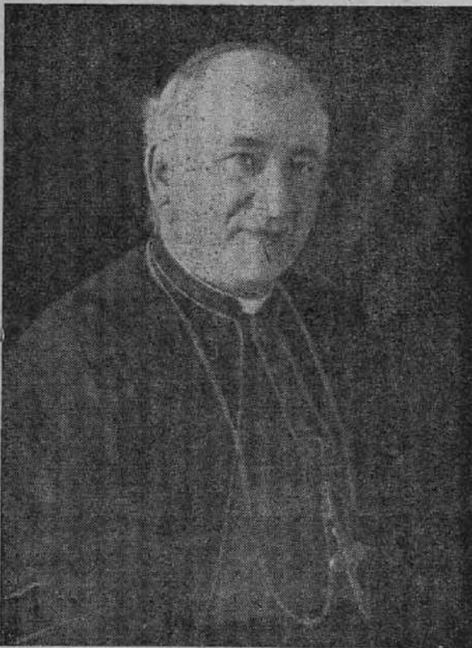
Dom Carlos Duarte Costa Bispo do Rio de Janeiro

Essa a Liberdade do VATICANO. Essa a Liberdade, que o VATICANO oferece, na hora mais crítica, mais angustiosa, à HUMANIDADE sofredora. Não há palavra que mais assuste, amedronte, o VATICANO que esta: LIBERDADE.