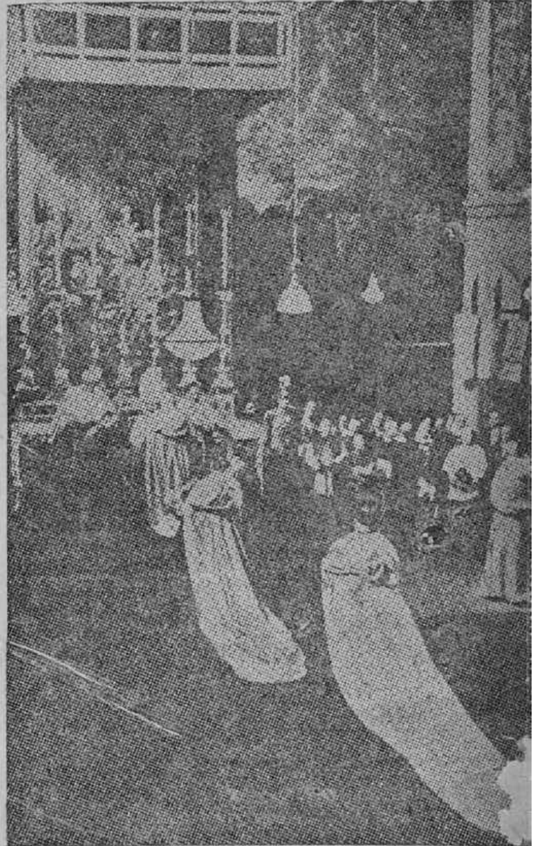
Para manter o fausto em que vive é que o Vaticano mantém a fé dos seus fiéis abusando de sua boa fé...