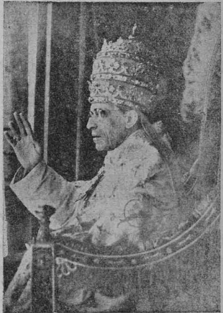
O "papa" coberto de ouro e pedrarias "abençoa" o povo esfarrapado e faminto que o sustenta e veste com suas esmolas. Desgraçado do que recebe a sua "benção" fatídica...

dão, em geral, como homens de govêrno, os que detem, ou aspiram o govêrno do país. Assim, a uns parece que essa questão, puramente moral, como a toado comum indús a crê-la, no predomínio das consciências, e em nenhuma alçada senão lá, tem de receber solução cabal; enquanto outros cuidam que as idéias sôbre a maneira de resolver um conflito, encoberto pela denominação vulgar sob as feições de espiritual, nada importam à ban-